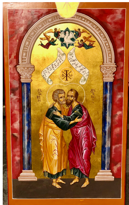
St Pierre et St Paul

l'unité ne peut être que pour la Gloire de Dieu, alors venez louer le Seigneur ; ne soyez pas comme les païens, en vous différenciant vous-mêmes dans le Christ ; vous devriez, vous tous qui êtes dans le Christ, vous aider les uns les autres et ainsi accomplir la Loi du Christ ; c'est un appel de la Mère de votre Seigneur à tous les Chrétiens ; le Seigneur vous prépare tous pour ce Jour Glorieux, vous tous qui êtes sous Son Nom ; oui, le Seigneur unira Son peuple et le délivrera de tous les maux ; la Miséricorde et la Justice accomplissent des merveilles telles qu'il n'y en a jamais eu depuis de nombreuses générations... et l'Unité viendra sur vous comme l'Aurore et aussi soudainement que la chute du communisme ; elle viendra de Dieu et vos nations l'appelleront le Grand Miracle, le Jour Béni de votre histoire ; ce Miracle sera pour la plus grande Gloire de Dieu, et ce jour-là, tout le Ciel célébrera et se réjouira profondément... c'est pourquoi Je vous implore, Mes enfants, d'être en prière constante et de vous aimer les uns les autres ; abandonnez-vous complètement à Dieu et Il fera le reste;